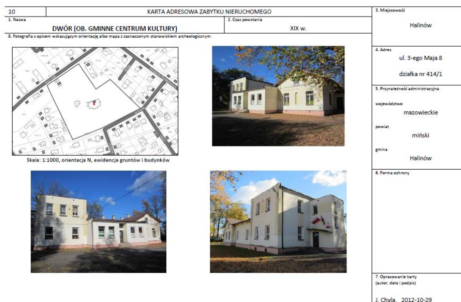
Rys. 2. Przykładowa karta gminnej ewidencji zabytków Gminy Halinów

remontach obiektów należy stosować materiały tradycyjne, używane w pracach konserwatorskich; dopuszczalna jest wymiana stolarki na analogiczną. Obowiązuje zakaz termomodernizacji budynków, zwrócić uwagę zwłaszcza z elewacjami ceramicznymi oraz wieszania billboardów (dopuszczalne jest jedynie umieszczanie reklam informacyjnych o usługach w parterach budynków, w sposób harmonizujący z zabudową). W parkach i tym podobnych założeniach ochronie podlega układ kompozycyjny, zieleń i mała architektura, a na cmentarzach - ich układ, zieleń komponowana, krzyże, figury i nagrobki sprzed 1945 r. W zespołach urbanistycznych ochronie podlega zieleń towarzysząca. Prace mogące mieć wpływ na elementy chronione wymagają opinii konserwatora (z wyjątkiem pochówków na cmentarzach).