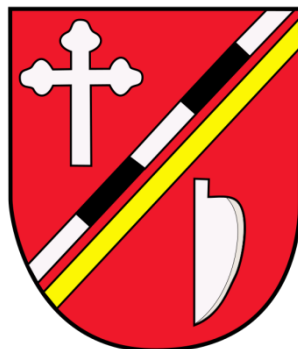
Rys 1. Herb Gminy Halinów

Herb nawiązuje do dwu ważnych traktów komunikacyjnych przechodzących przez teren gminy i stanowiących istotny czynnik jej powstania, istnienia i rozwoju: