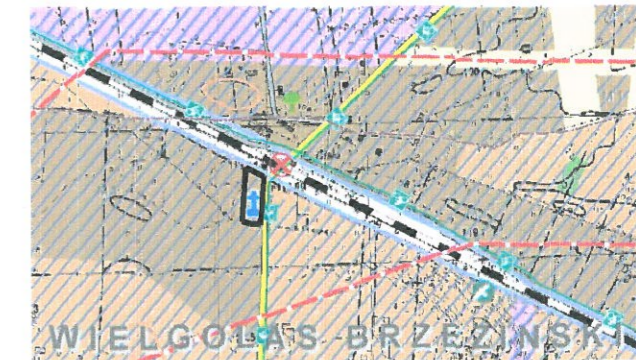
GRANICE OBSZARU OBJĘTEGO PLANEM