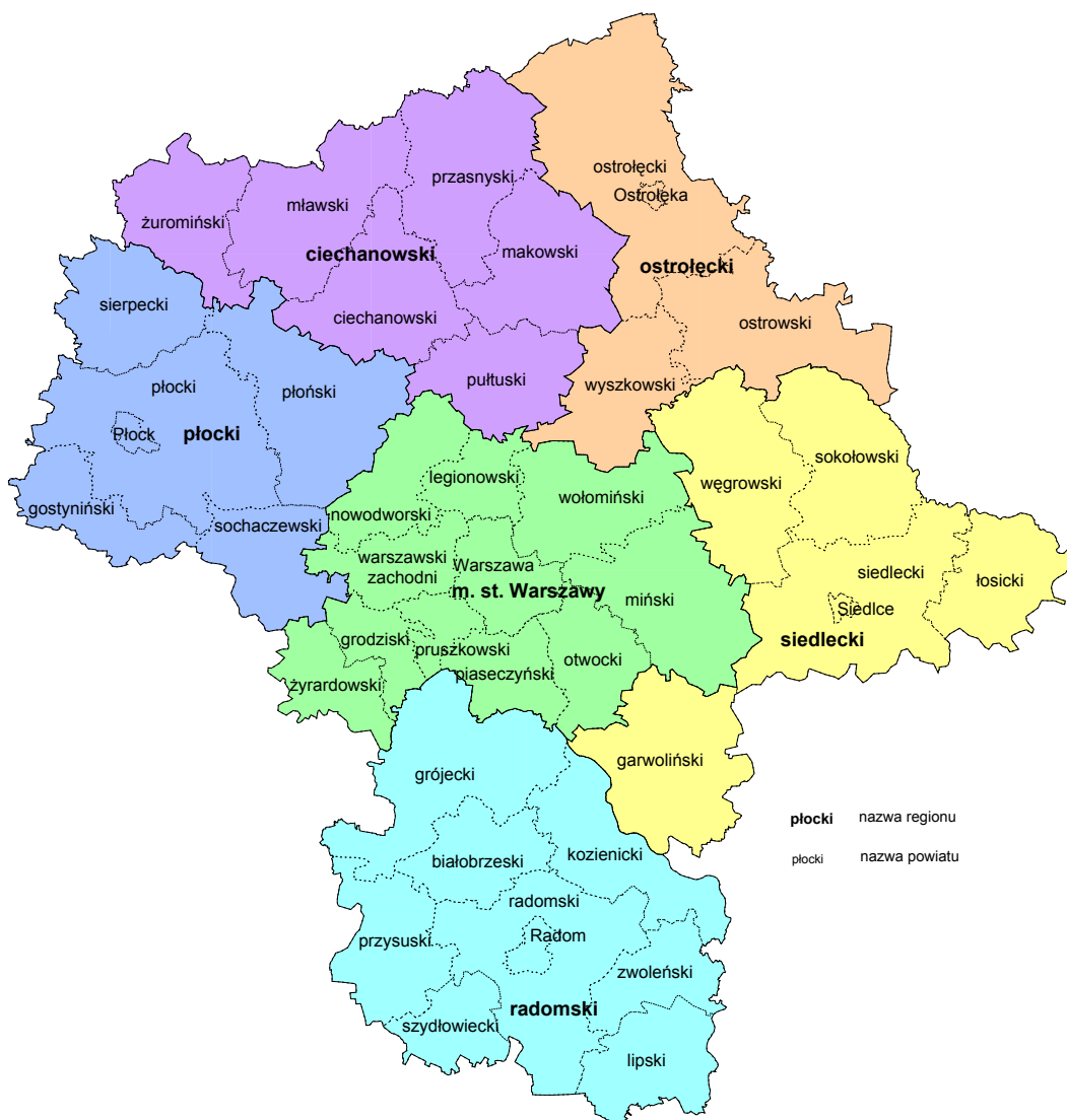
Rysunek 3. Proponowane obszary gospodarowania odpadami w ramach Regionalnych Zakładów Gospodarki Odpadami na terenie Województwa Mazowieckiego

Zakłada się, że odzysk odpadów komunalnych zbieranych na terenie Halinów prowadzony będzie w zakładzie gospodarowania odpadami tj. zbierania (w tym magazynowania) i odzysku odpadów w Jakubowie należącym do firmy „EKO – SAM” BIS, którego roczne moce przerobowe (wg. „decyzji środowiskowej” wydanej przez Wójta Gminy Jakubów i według zatwierdzonego przez Starostę Mińskiego projektu budowlanego) wynosić będą 40 000 ton. Zbierane z terenu gminy odpady będą przewożone do zakładu „EKO – SAM” BIS gdzie następnie będą sortowane (odzyskiwane) w celu przygotowania ich do dalszego odzysku bądź do unieszkodliwiania tj. składowania.